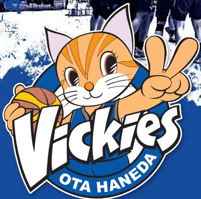
6 星澤 真 MAKOTO HOSHIZAWA